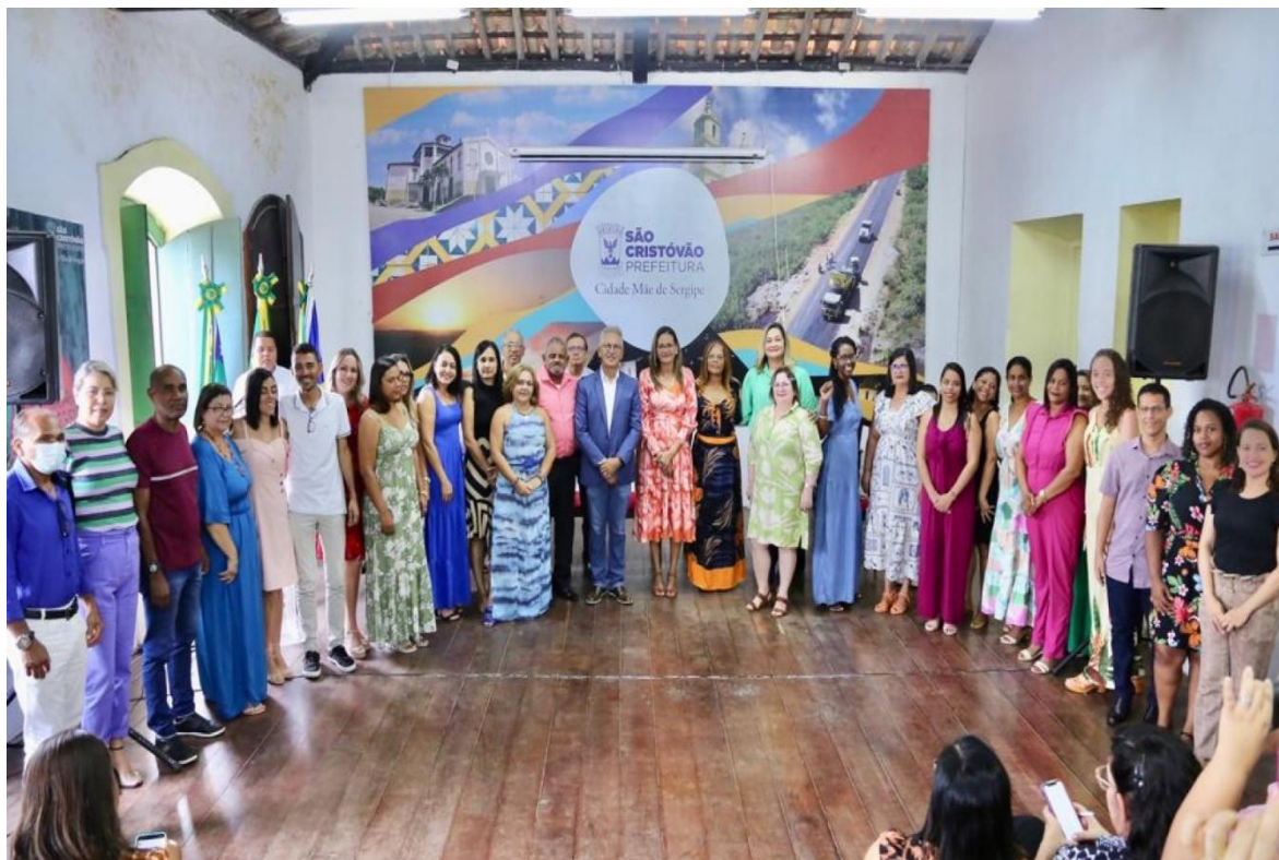
Figura 2 - SEMED realiza a Semana Pedagógica 2023 com professores e gestores do município